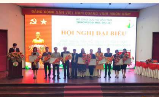
Trao thưởng cho các tập thể và cá nhân đạt thành tích cao trong năm học 2019-2020

Sau một buổi làm việc khẩn trương, nghiêm túc, Hội nghị đã thống nhất đưa ra Nghị quyết thực hiện nhiệm vụ năm học 2020-2021. Với sự đồng thuận cao của tập thể nhà giáo, cán bộ quản lý và người lao động của Trường, Trường Đại học Đà Lạt mong muốn sẽ tiếp tục phát triển mạnh mẽ trong thời gian tới./.