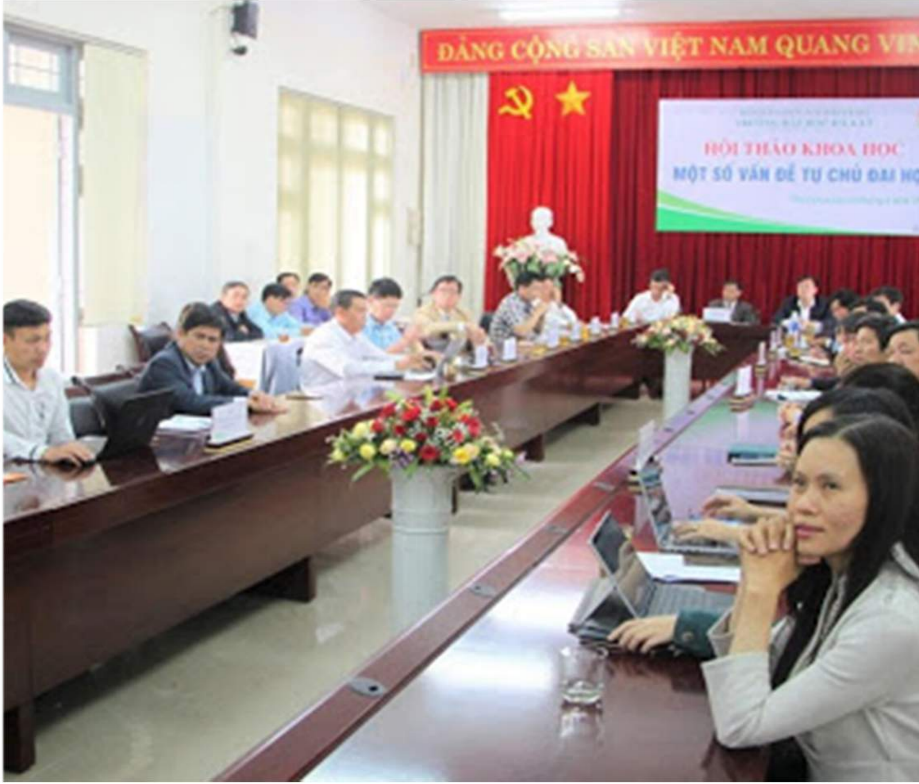
Toàn cảnh Hội thảo khoa học “Một số vấn đề tự chủ đại học”

Vào chiều ngày 28/4/2021, tại phòng họp Nhà A11, Trường Đại học Đà Lạt đã tổ chức Hội thảo khoa học với chủ đề “Một số vấn đề tự chủ đại học”.