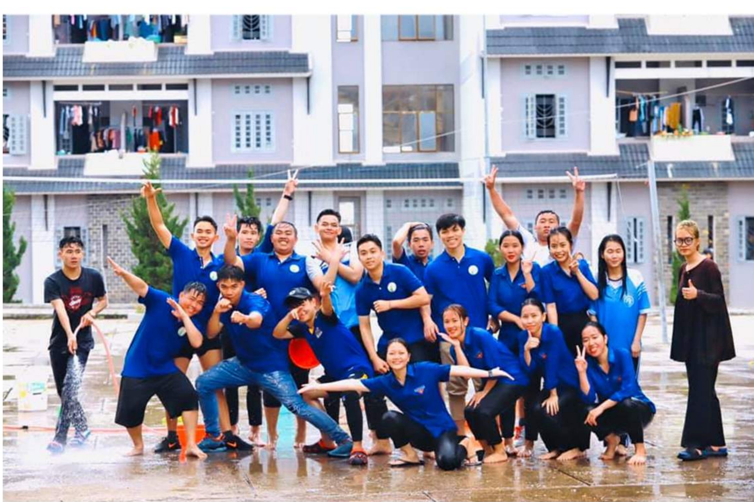
14/4/2021_Tuổi trẻ Đại học Đà Lạt tổ chức các hoạt động chào mừng Tết cổ truyền Bunpimay cho sinh viên Lào đang học tập tại Trường Đại học Đà Lạt