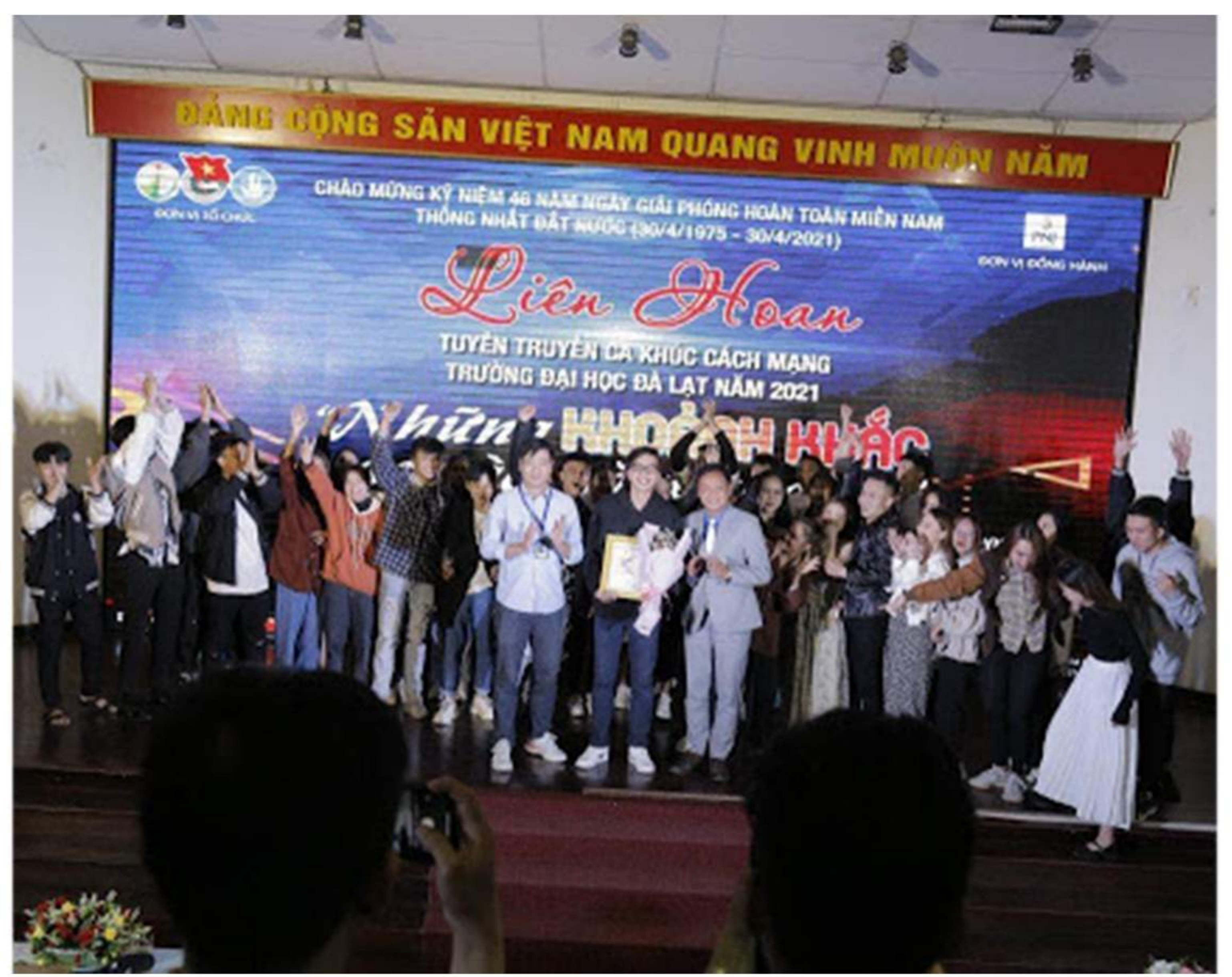
Văn phòng Đoàn trường