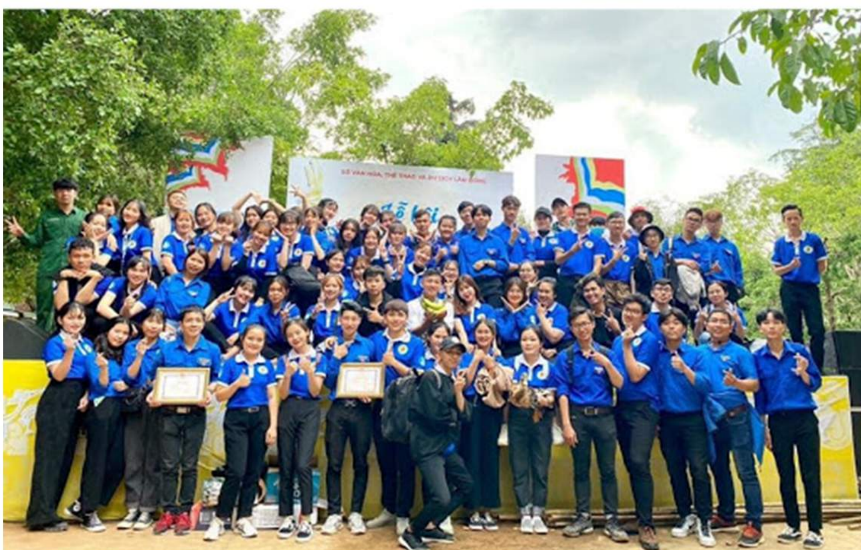
21/4/2021_Tuổi trẻ Đại học Đà Lạt tham gia lễ hội Giỗ tổ Hùng Vương năm 2021