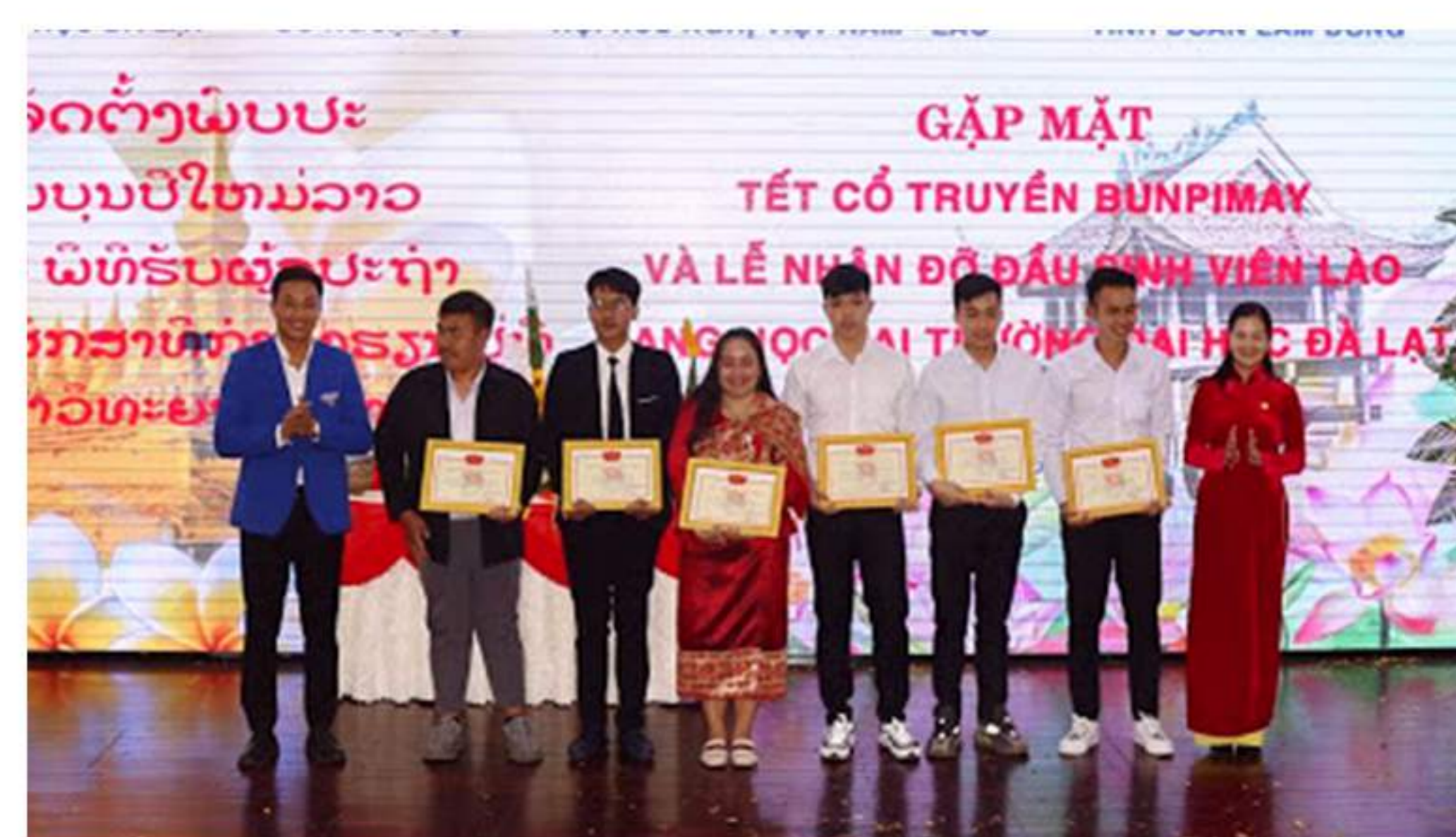
Các sinh viên Lào nhận khen thưởng về thành tích hoạt động phong trào tuổi trẻ của Đoàn Trường Đại học Đà Lạt.

Buổi Lễ đón Tết cổ truyền Bunpimay của nhân dân các bộ tộc Lào và nhận đỡ đầu 22 sinh viên Lào đang học tập tại Trường Đại học Đà Lạt đã thể hiện mong muốn phát huy tinh thần đoàn kết và thắt chặt mối quan hệ hữu nghị giữa nhân dân hai nước Việt Nam – Lào nói chung và giữa nhân dân tỉnh Lâm Đồng với nhân dân hai tỉnh Champasak và Bolykhamxay nói riêng; đồng thời, tạo điều kiện để sinh viên Lào đang học tập tại Trường Đại học Đà Lạt được đón Tết cổ truyền của nhân dân các bộ tộc Lào – Tết Bunpimay trong một không khí đầy ấm áp và nghĩa tình; từ đó, giúp các em sinh viên Lào có thêm cơ hội giao lưu, tìm hiểu về văn hóa, con người Việt Nam.