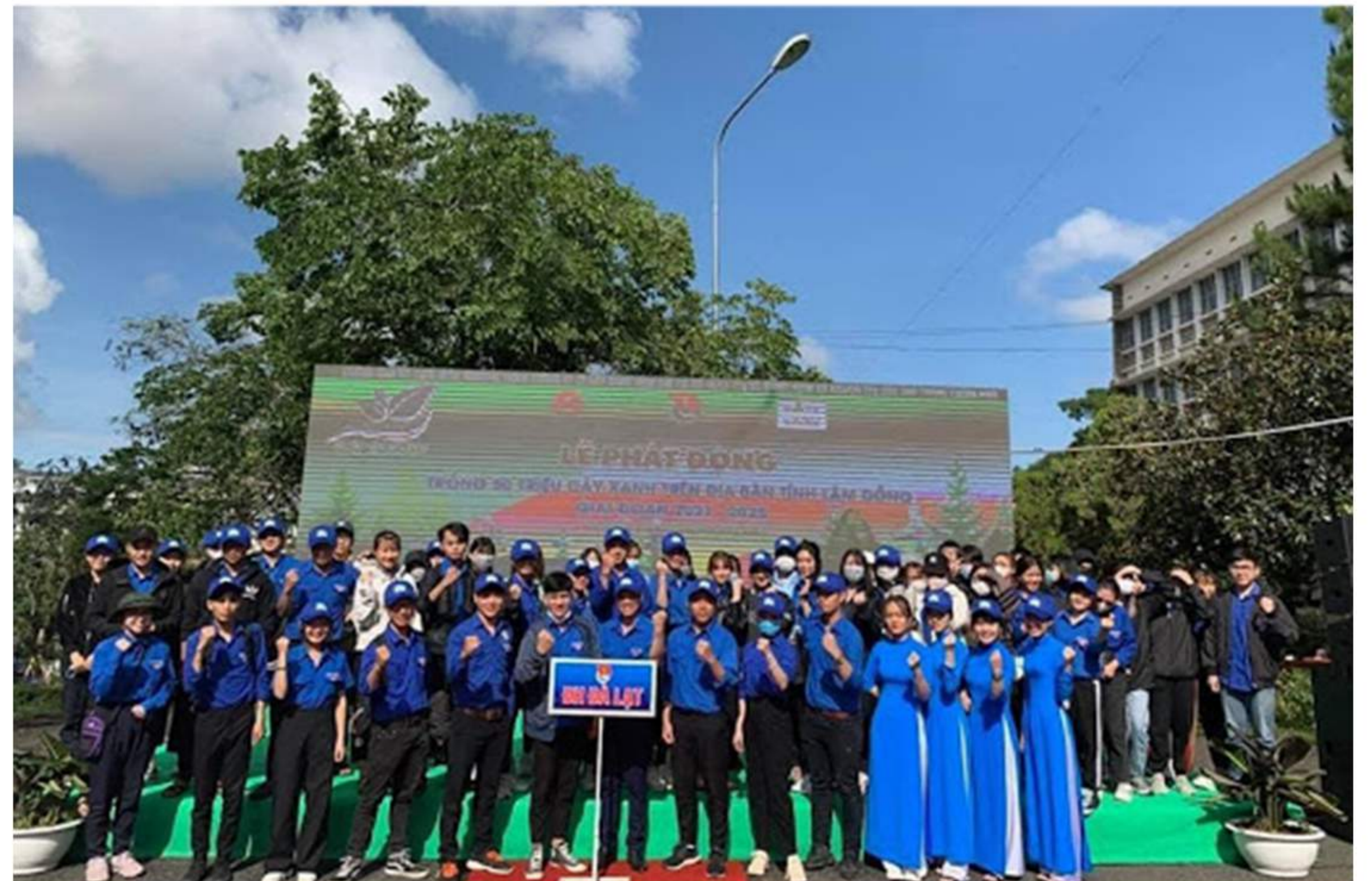
23/4/2021_Tuổi trẻ Đại học Đà Lạt tham gia Lễ phát động trồng 50 triệu cây xanh trên địa bàn Tỉnh giai đoạn 2021-2025