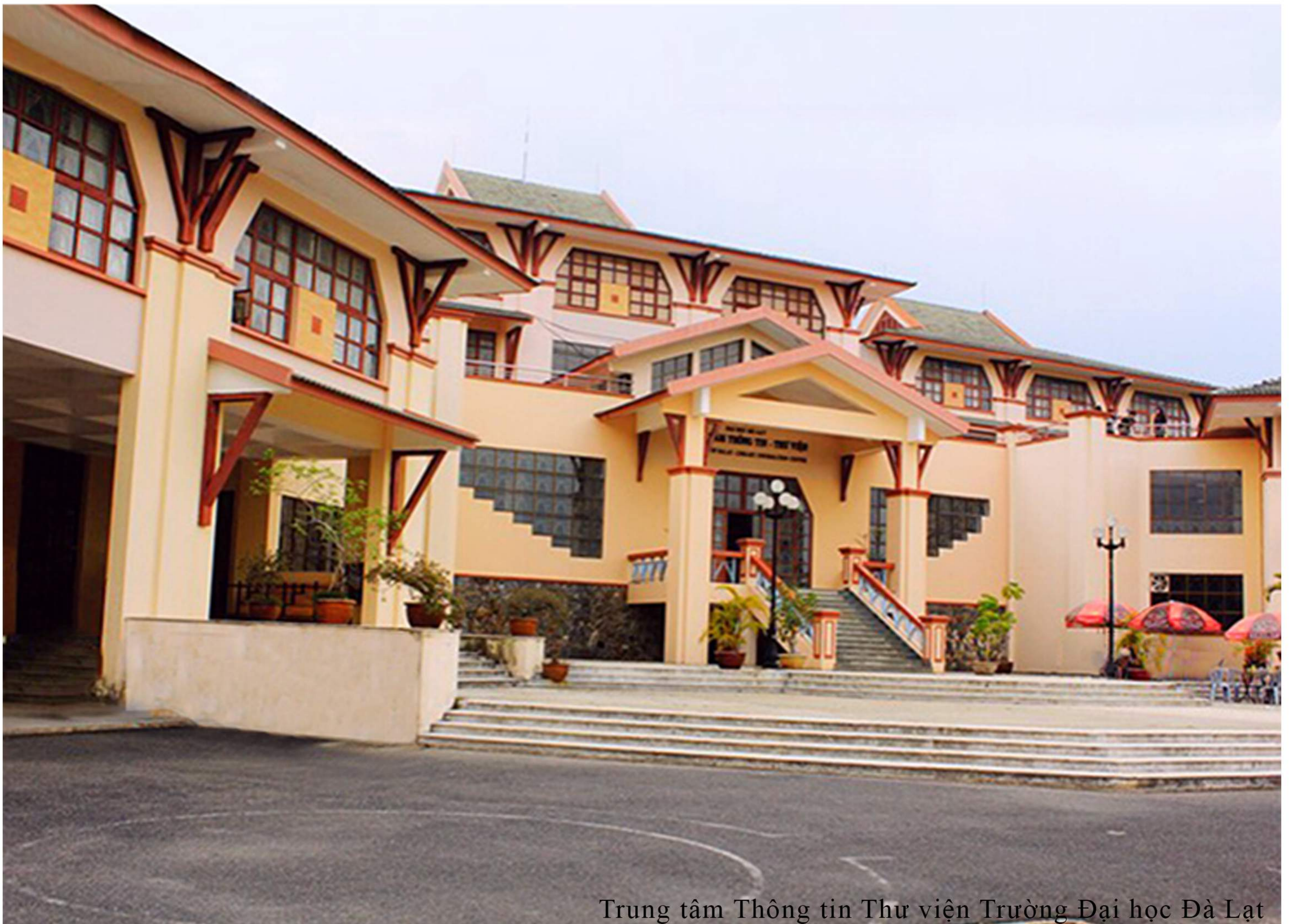
Trung tâm Thông tin Thư viện Trường Đại học Đà Lạt