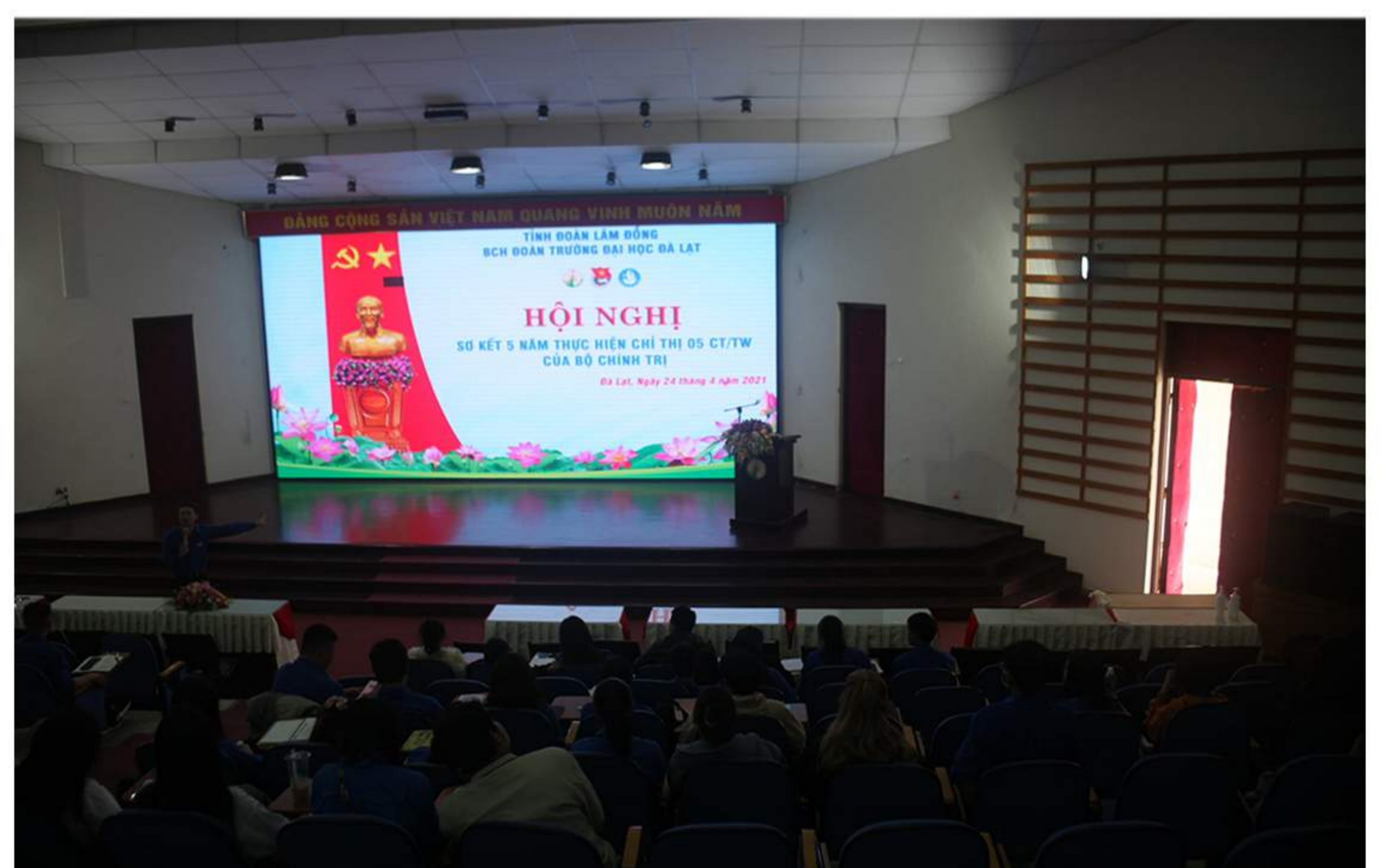
24/4/2021_Tuổi Trẻ Đại học Đà Lạt tổ chức Hội nghị Sơ kết 5 năm thực hiện Chỉ thị số 05-CT/TW ngày 15/5/2016 của Bộ Chính trị (khóa XII) về “Đẩy mạnh học tập và làm theo tư tưởng, đạo đức, phong cách Hồ Chí Minh”