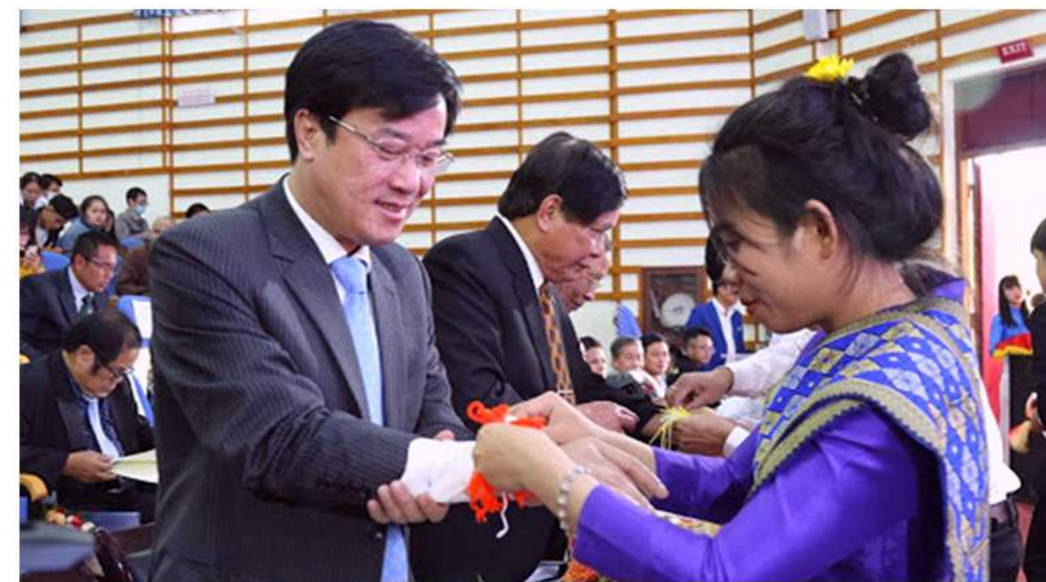
Nghi thức buộc chỉ cổ tay

Vì vậy, trong dịp này, các sinh viên Lào đã trân trọng tiến hành nghi thức buộc chỉ cổ tay cho các đại biểu, các gia đình đỡ đầu tham dự buổi Lễ.