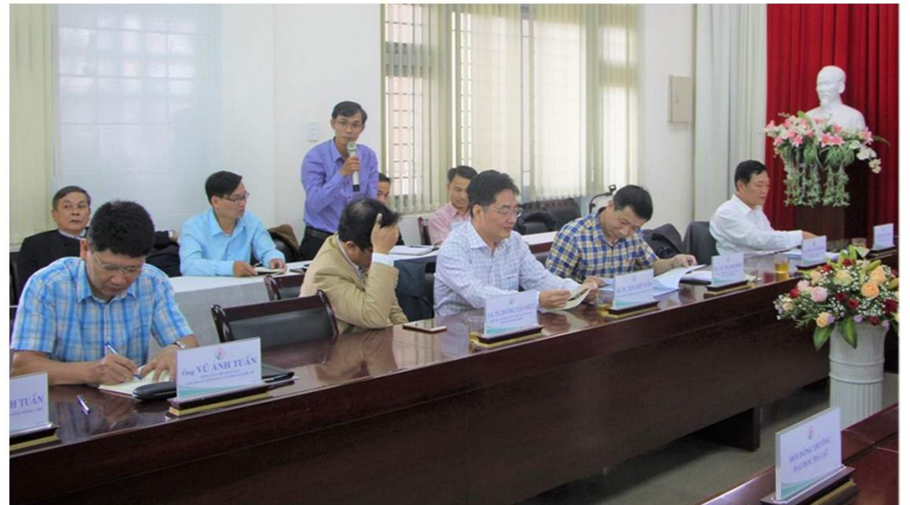
Đại biểu tham dự Hội thảo đặt câu hỏi về các vấn đề liên quan đến tự chủ đại học

Tại Hội thảo, các đại biểu tham dự cũng đã trực tiếp trao đổi, thảo luận cụ thể hơn về các vấn đề liên quan đến tự chủ đại học cũng như tìm hiểu thêm về các mô hình hoạt động, thành tựu cụ thể về tự chủ đại học tại các trường đại học trong và ngoài nước.