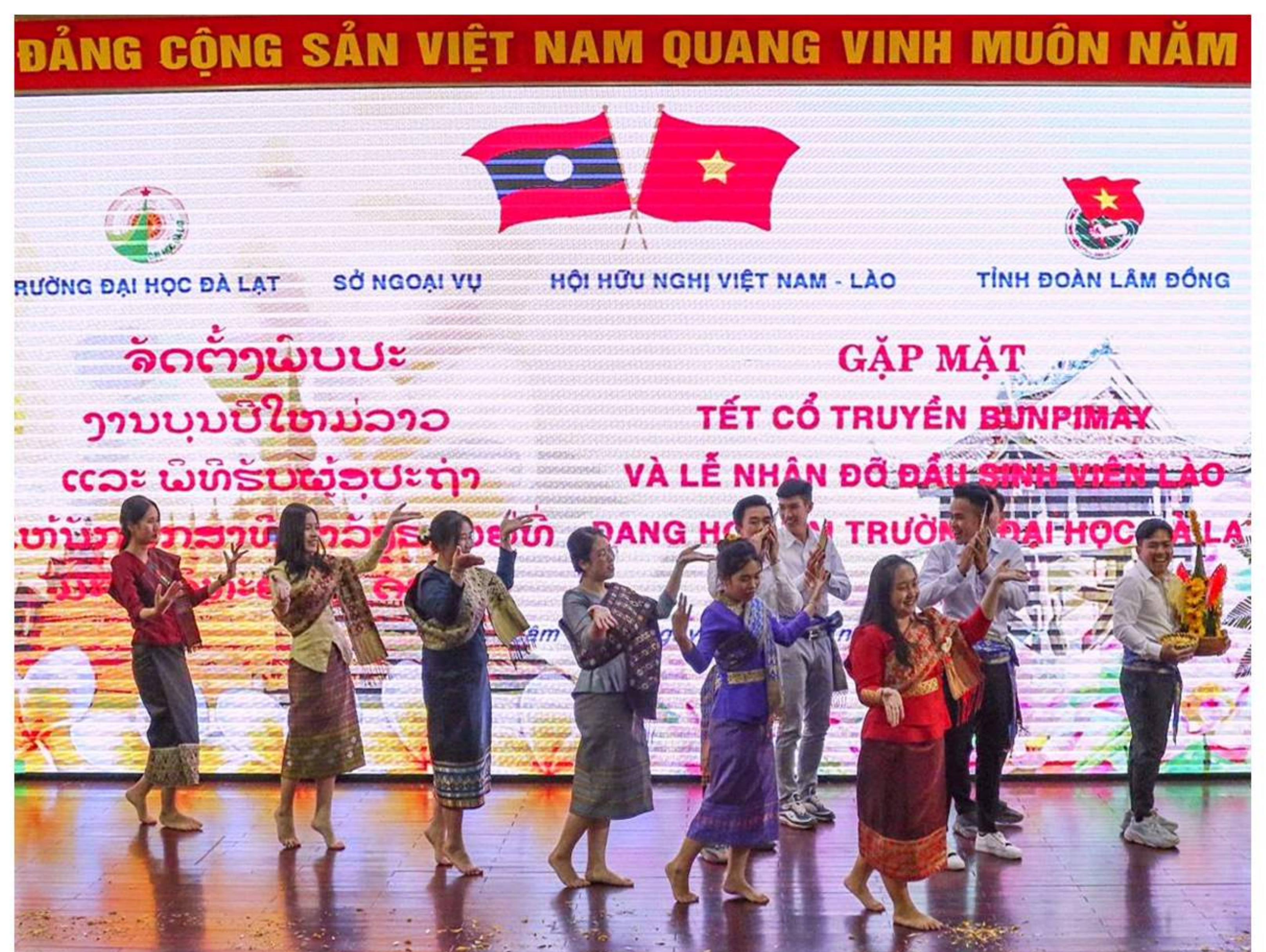
Tiết mục văn nghệ của các sinh viên Lào đang học tập tại Trường Đại học Đà Lạt