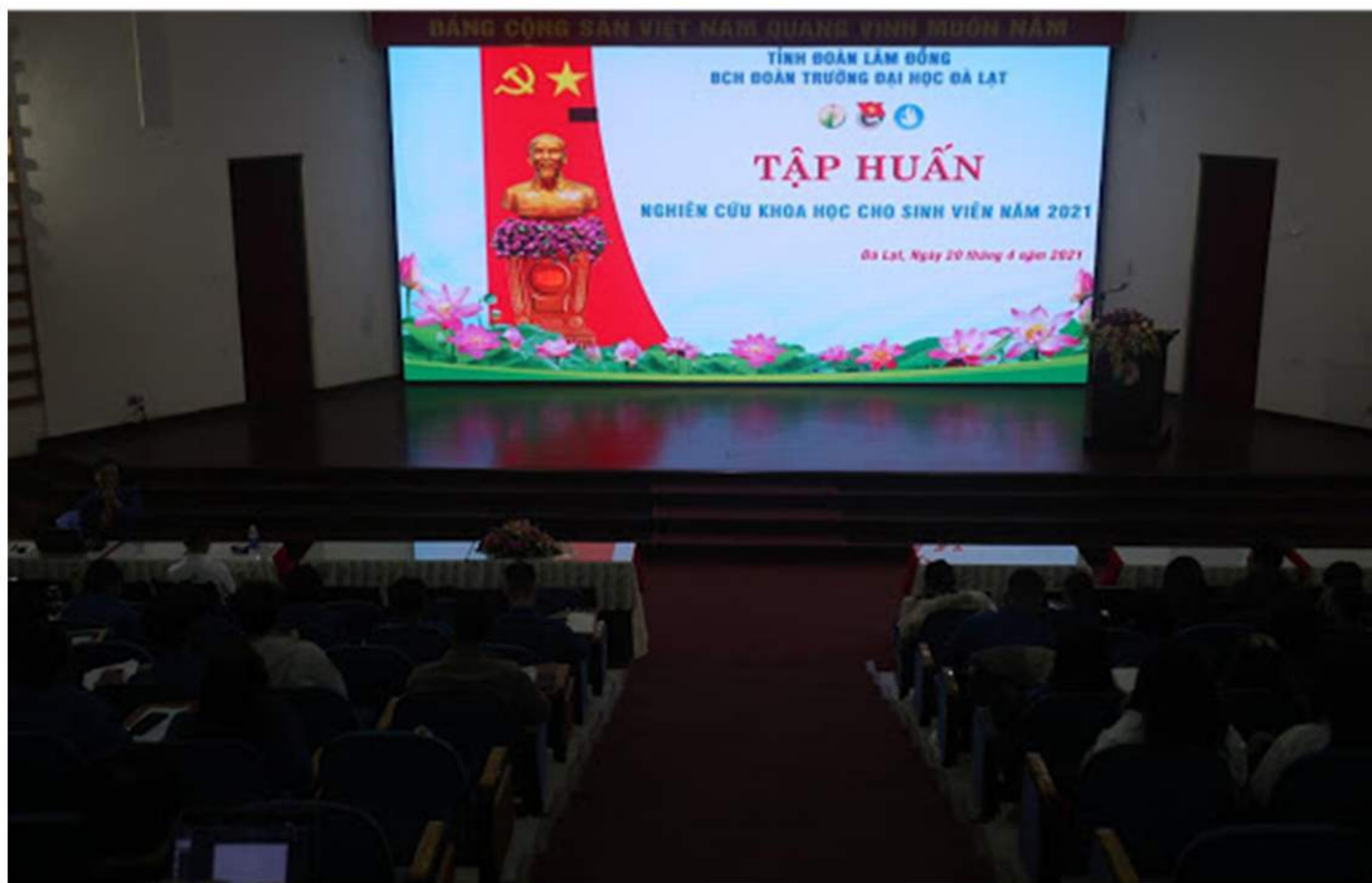
20/4/2021_Tuổi Trẻ Đại học Đà Lạt tổ chức tập huấn nghiên cứu khoa học cho sinh viên