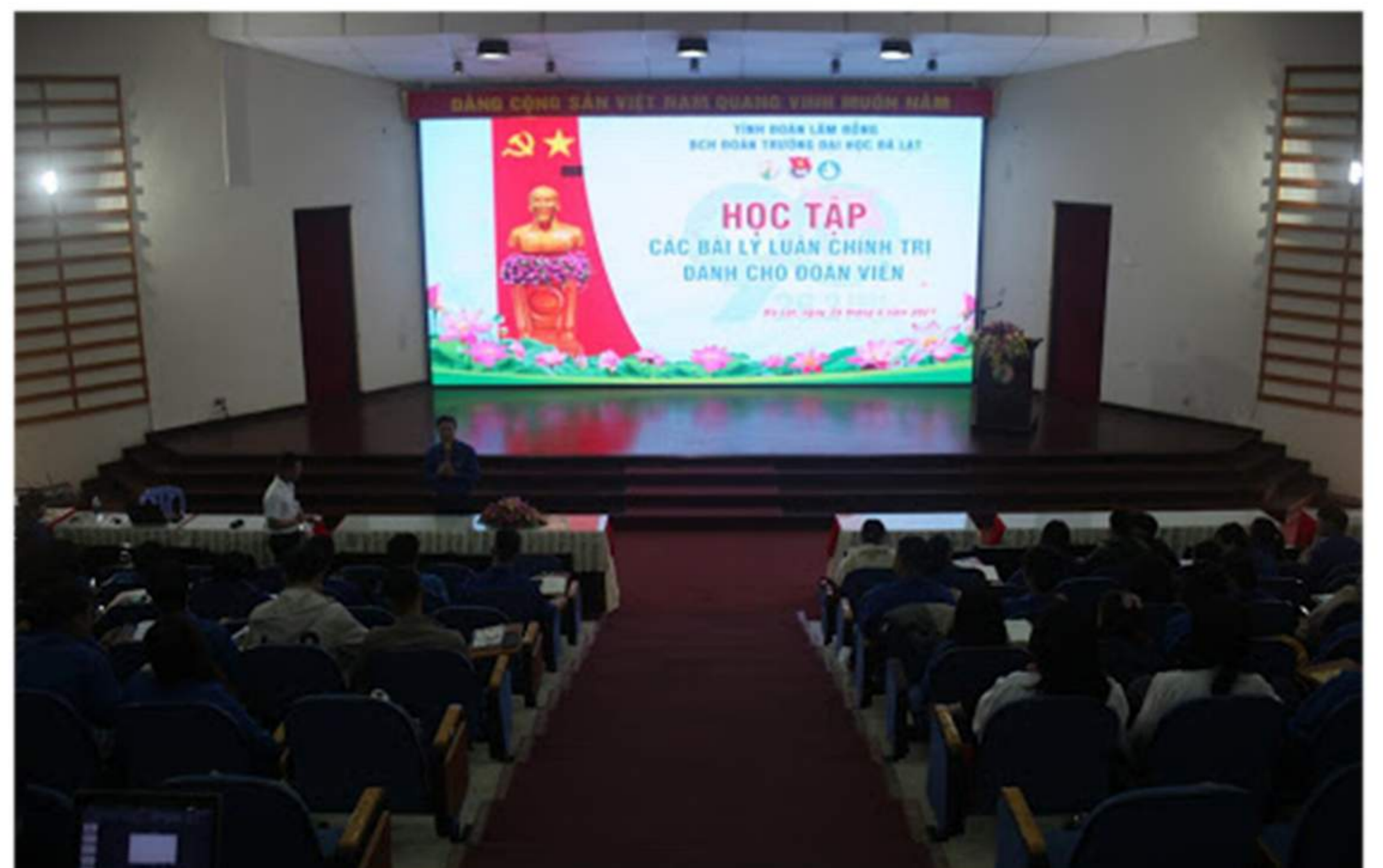
24/4/2021_Tuổi trẻ Đại học Đà Lạt tổ chức học tập các bài học lý luận chính trị cho Đoàn viên, thanh niên