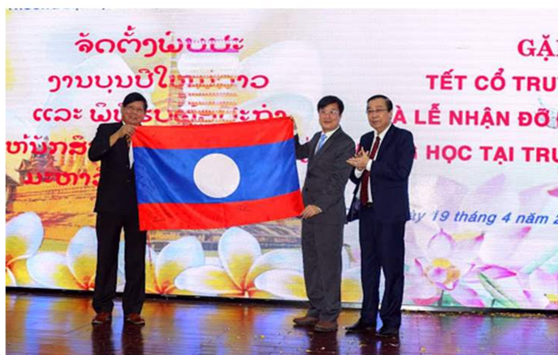
Trao cờ Tổ quốc Lào cho Trường Đại học Đà Lạt